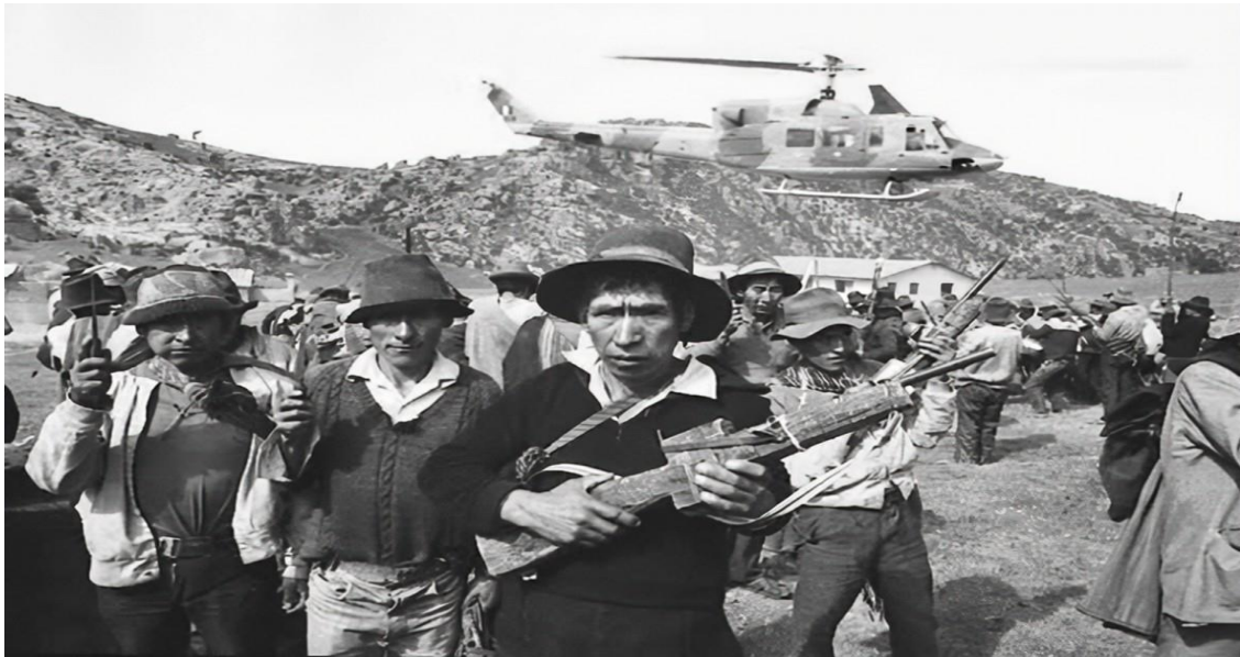
Figura 1. El Ejército Peruano y el Conflicto Armado Interno (1980-2000).