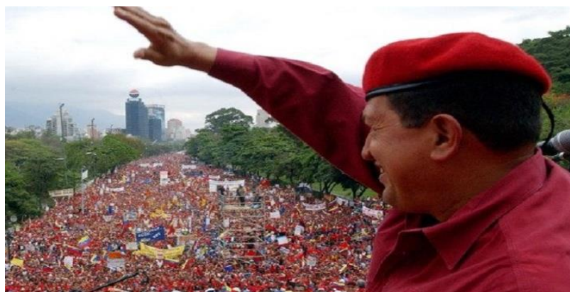
Figura 8: Una marea roja en Caracas

En 16 de mayo de 2004 fue un momento importante en la historia de Venezuela. En la calle Bolívar, En medio de una gran cantidad de seguidores vestidos de rojo, el líder eterno Hugo Chávez proclamó que la Revolución Bolivariana y el sistema de gobierno serían antiimperialistas.