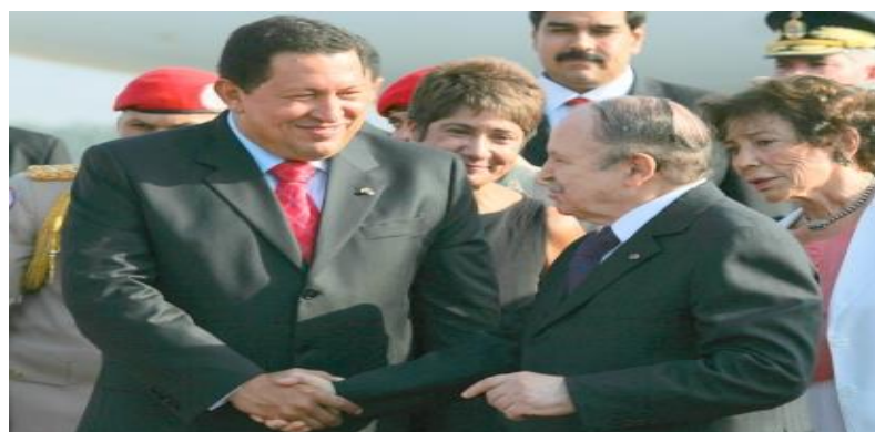
Figura 6: La visita de Chávez a Argelia

El presidente Hugo Chávez llegó a Argelia como parte de su gira por África. reunió con el presidente Abdelaziz Buteflika. Esta es su cuarta visita a Argelia, lo que ha contribuido a reactivar la cooperación bilateral entre Venezuela y Argelia ( http://www.psuv.org.ve ).