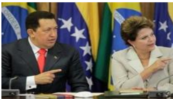
Figura 2: Una cooperación más estrecha entre ambos

Durante su visita a Brasil, Hugo Chávez y la presidenta Dilma Rousseff firmaron varios acuerdos de cooperación.