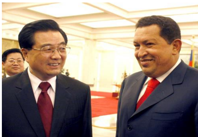
Figura 3: Concreta Chávez acuerdo militar y energético con China