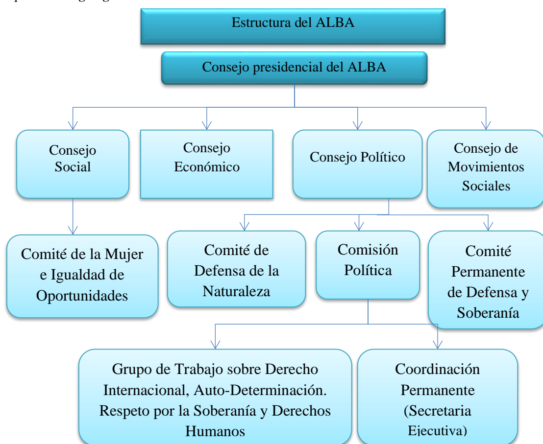
Esquema 1: Organigrama del ALBA-TCP

El legado de Fidel y Chávez en la fundación de una alianza basada en la paz, cooperación y solidaridad para Nuestra América, instando a los líderes actuales y sus pueblos a seguir su ejemplo en la búsqueda de la integración plena y el bien común. En el año 2006, el presidente boliviano Evo Morales propuso enriquecer el ALBA con el Tratado de Comercio de los Pueblos (TCP), un mecanismo solidario de intercambio entre países para beneficiar a las poblaciones (López, 2023).