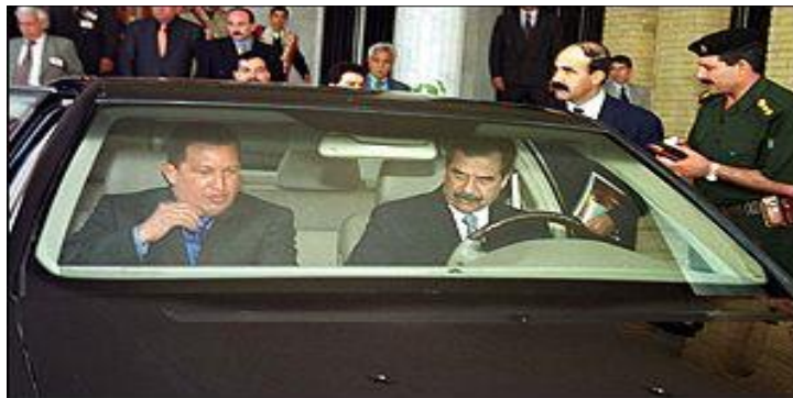
Figura 5: La buena amistad entre ambos

Chávez compartió que se sintió impresionado al ser llevado por las calles de Bagdad en un automóvil manejado por Saddam Hussein. Además, mencionó que sus conversaciones con Saddam, junto con la cena que compartieron, resultaron ser fructíferas, especialmente al discutir formas de fortalecer la OPEP ( https://www.lanacion.com ).