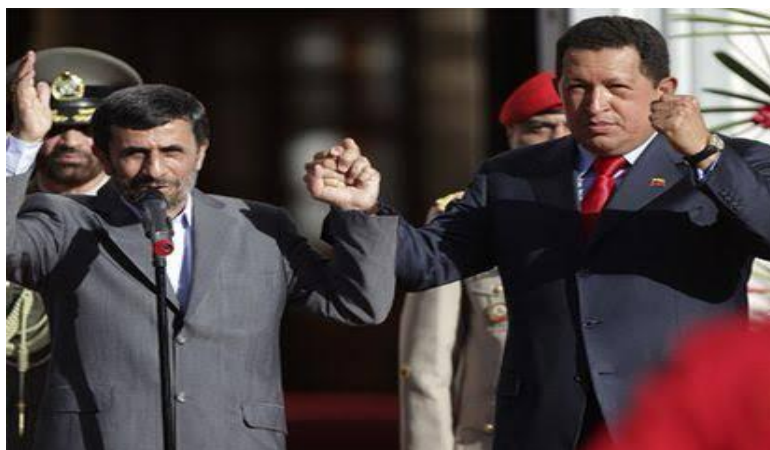
Figura 7: Hugo Chávez y la alianza con Irán