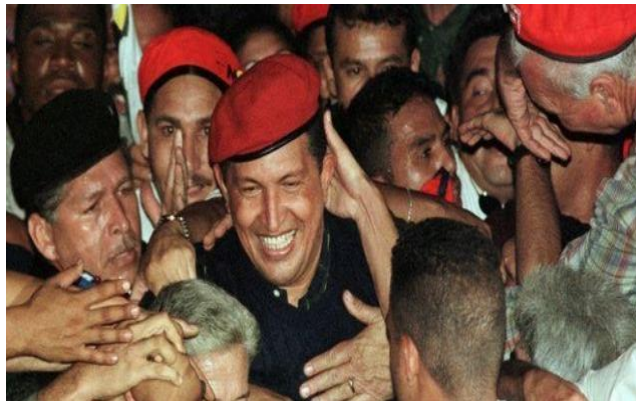
Figura 1. 13 de abril el día de la victoria

En medio de la creciente movilización popular con consignas, los militares constitucionalistas se levantaron contra Carmona, quien se vio obligado a renunciar ante la presión del gobierno. Diosdado Cabello, en su calidad de vicepresidente Ejecutivo, asumió temporalmente la presidencia de Venezuela mientras se llevaba a cabo el rescate de Chávez. Tras el avance de las tropas y la presión del pueblo alrededor del Palacio de Miraflores, los golpistas huyeron. Más tarde, se anunció que Chávez había sido rescatado y regresó al Palacio en un helicóptero a altas horas de la madrugada ( https://www.telesurtv.net ).