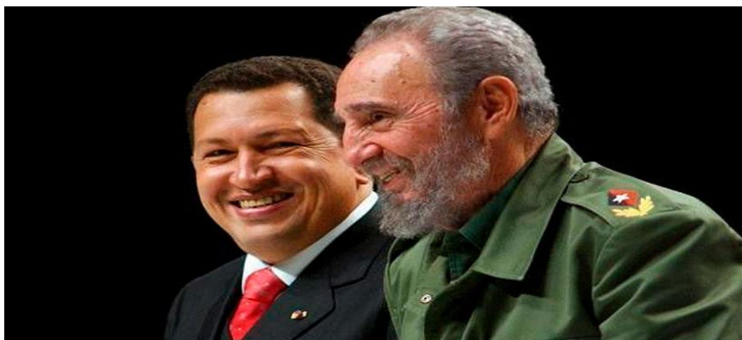
Figura 9: La amistad entre Chávez y Castro

Desde que Chávez asumió el poder, las relaciones entre Venezuela y Cuba se volvieron estratégicas y amistosas. Chávez consideraba a la Revolución Cubana como una fuente de inspiración, aunque reconocía las diferencias entre ambos procesos políticos y sociedades. La influencia cubana era evidente en los discursos de Chávez, quien mencionaba a Fidel o Raúl Castro. Además, la experiencia cubana servía como referencia para evaluar la propia revolución venezolana.