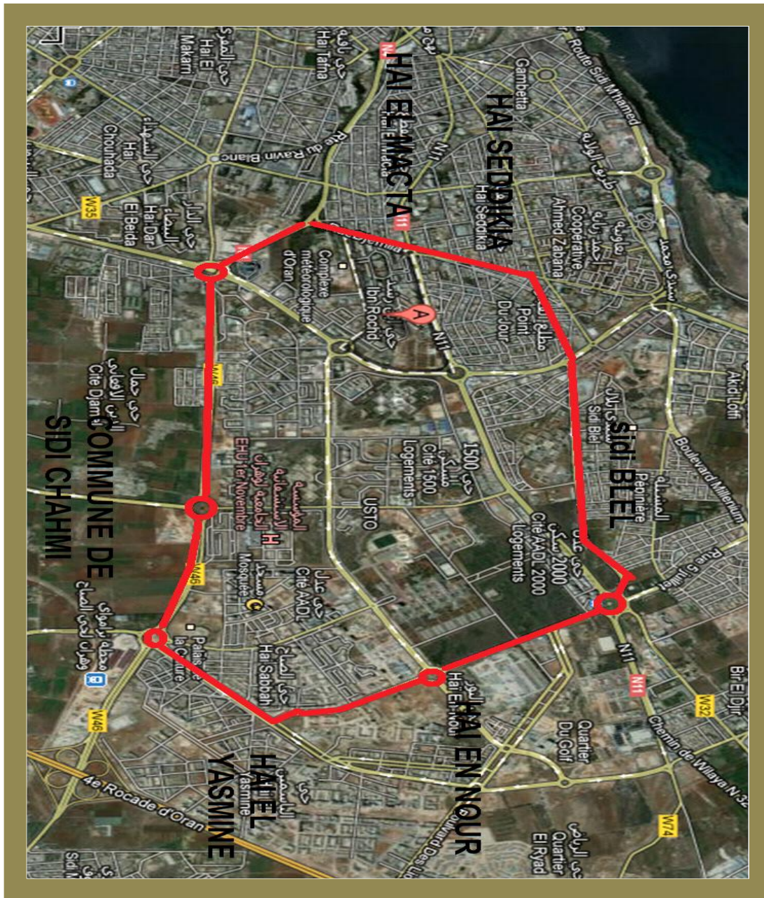
Schéma montre le Périmètre d'étude

La zone d'étude présente des vastes programmes d'extensions menée à partir des années 80. Ce qui implique un bon état au niveau de construction.