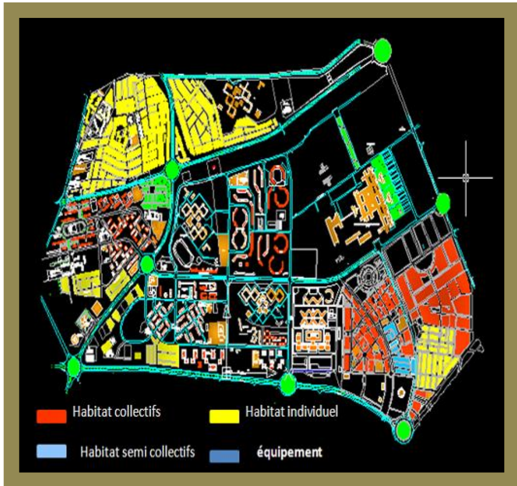
Schéma montre les différents types de l'habitat.

4.2 LES EQUIPEMENTS : Ils sont répartis en trois catégories.