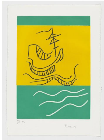
ANEXO 3: Galéon al viento