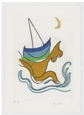
ANEXO 9: Canto de sirenas