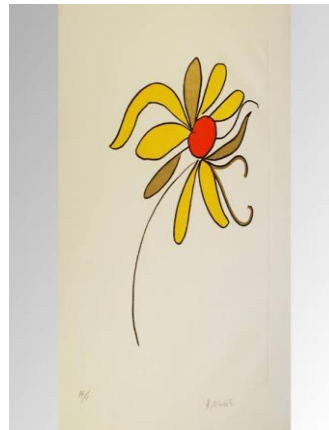
ANEXO 8: Amarillo de Abril