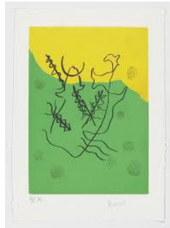
ANEXO 4: Toro de la muerte