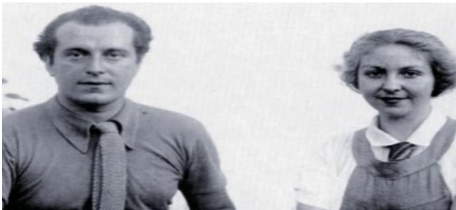
Anexo 2 : Rafael Alberti con su mujer Maria Teresa León