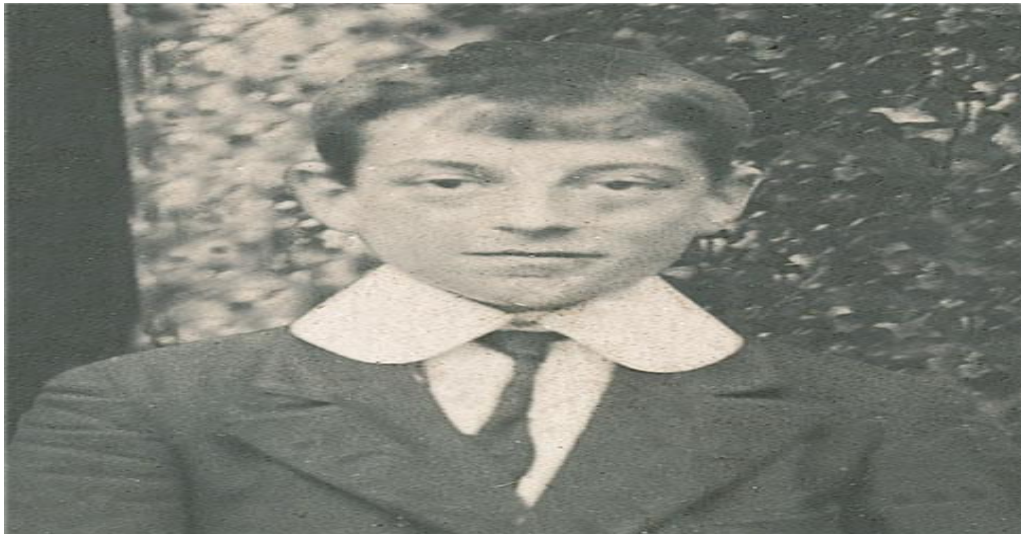
Anexo 1 : Rafael Alberti Niño