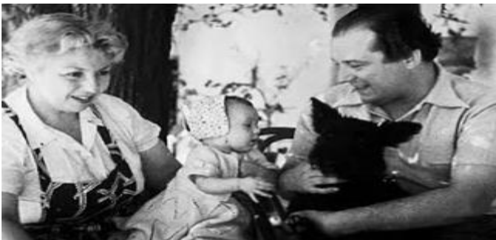
Anexo 3 : Rafael Alberti Con su mujer y su hija