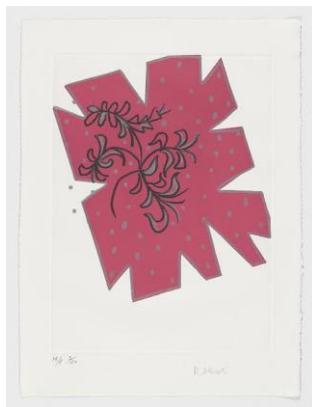
ANEXO 7: Flor de invierno