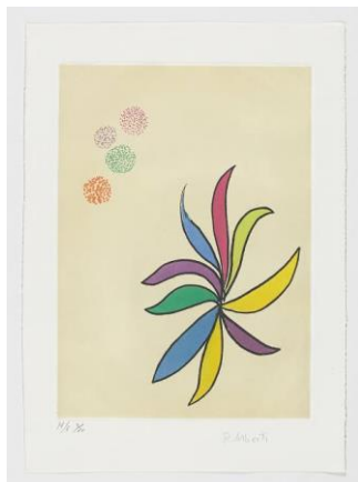
ANEXO 5: Dalia en el viento