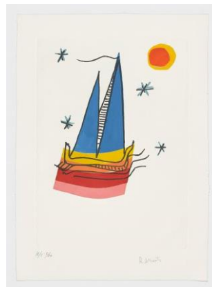
ANEXO 10: Barco Perdido