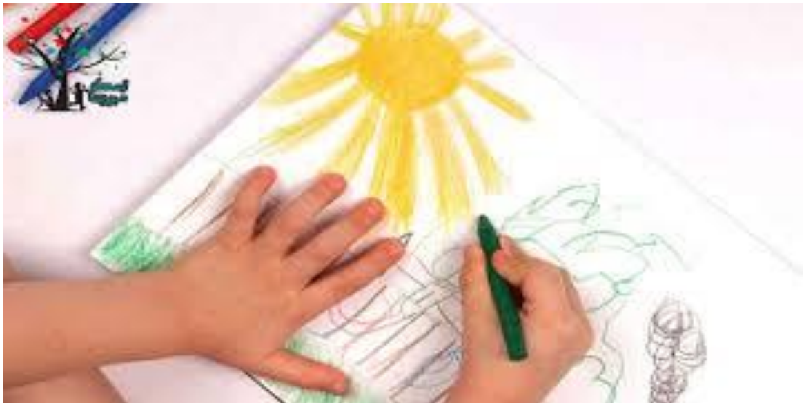
figura n°5: El juego del dibujo