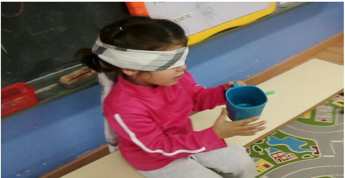
figura n°3 : Muestra Exploración de objetos a través del tacto