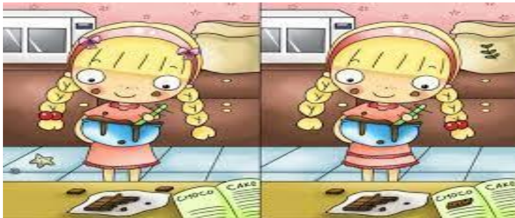
figura n°4: El juego de los 7 siete errores