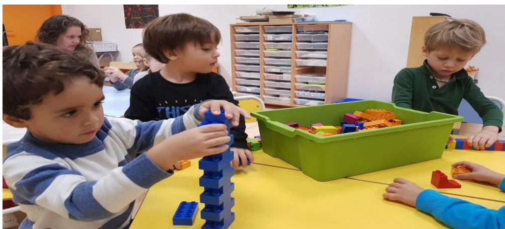
figura n°2 : Muestra el juego de construcción