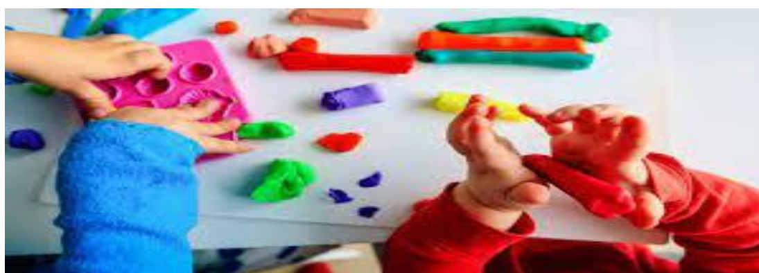
Figura n°1: Muestra el juego de arcilla