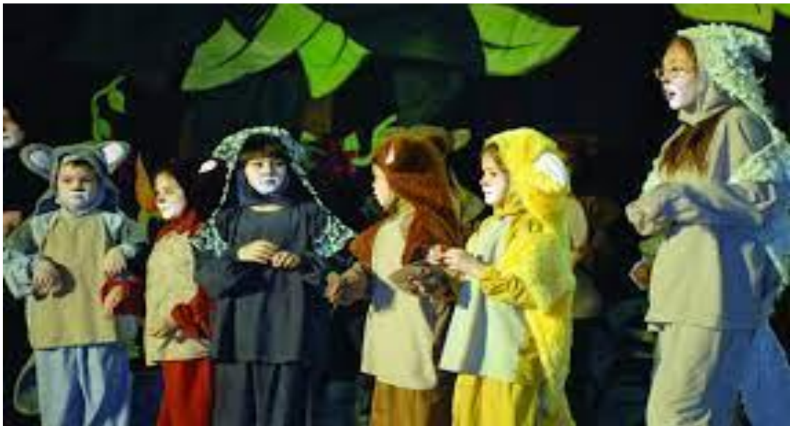
Imagen n°7: Muestra el juego teatral de los niños de la guardería infantil