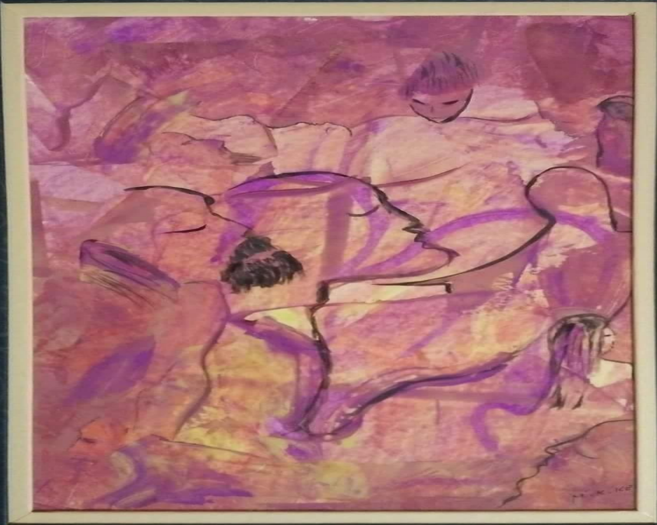
لوحة ارواح بريئة (لوحة زيتية على قماش) للفنان محمد خير الدين قلوش