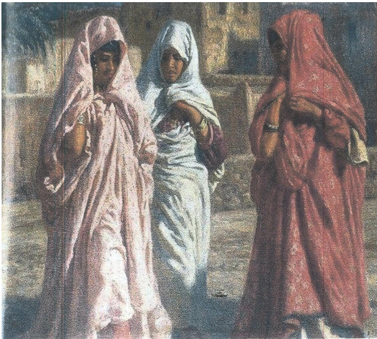
لوحة نساء بوسعادة ( لوحة زيتية على قماش) سنة 1889/1904 للفنان اتيان ديني