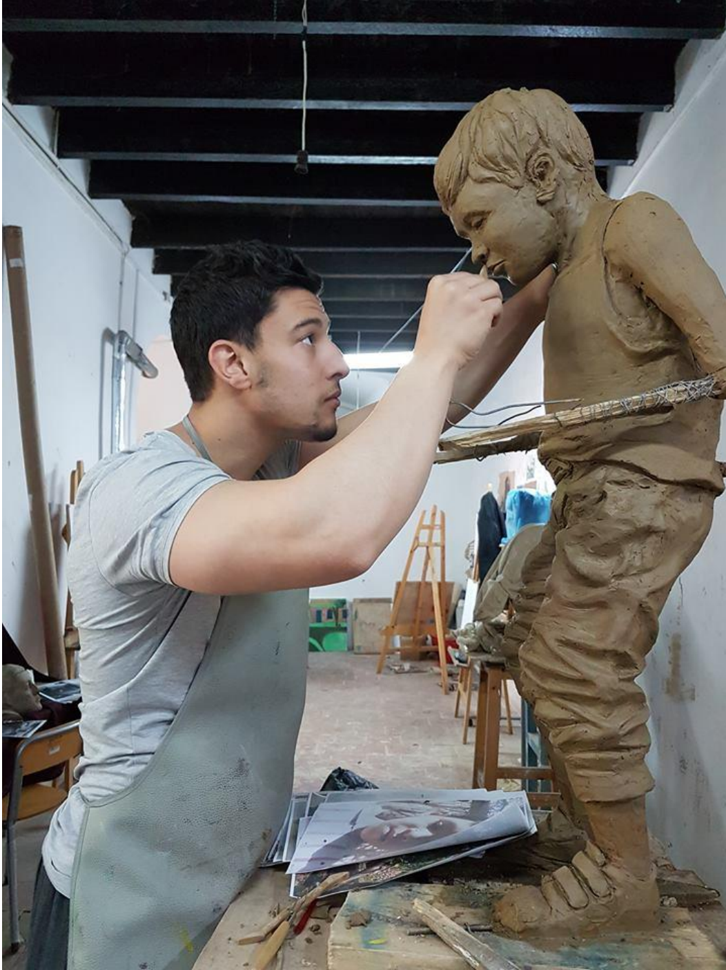
لقاء مع الفنان بوسدير محمد بتاريخ 2018/05/05 المكتبة العمومية محمد ديب تلمسان .