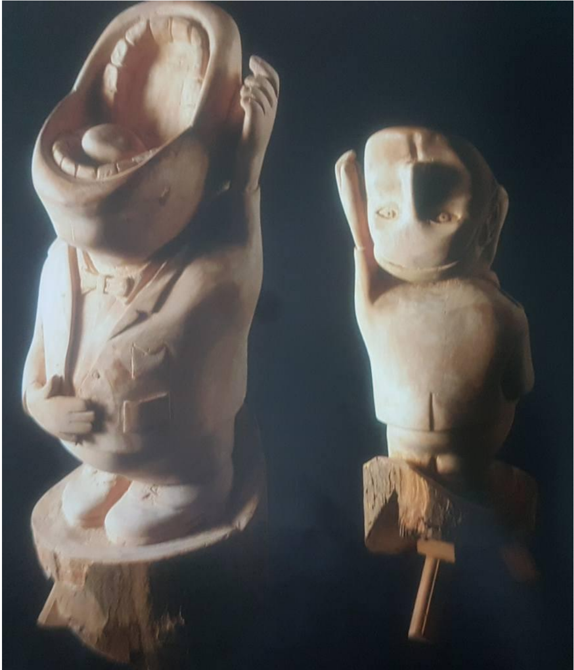
Union Nationale des Arts Culturel , La Sculpture Algérienne p30.