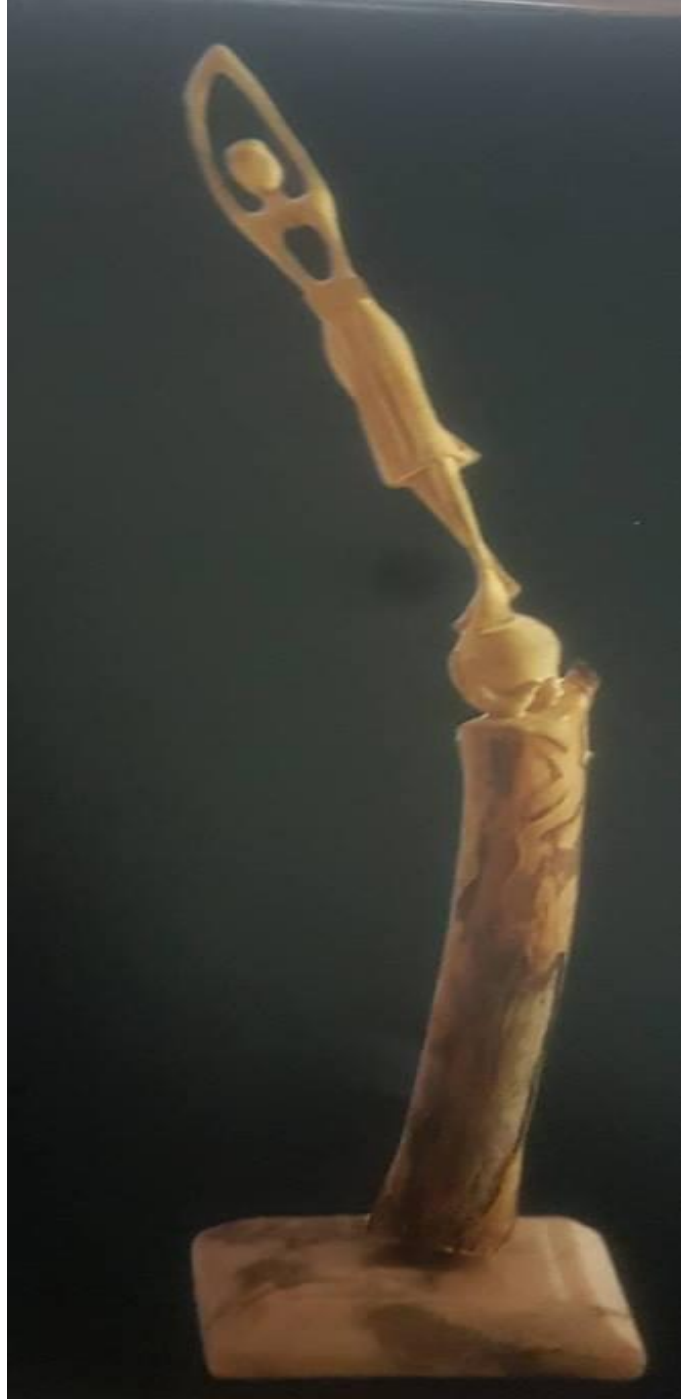
المرجع نفسه ص 50