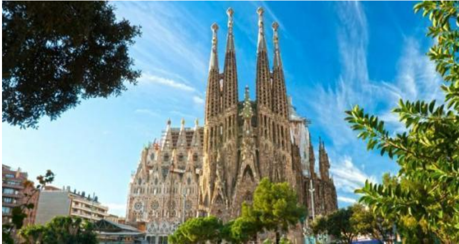
Sadrada Familia 44