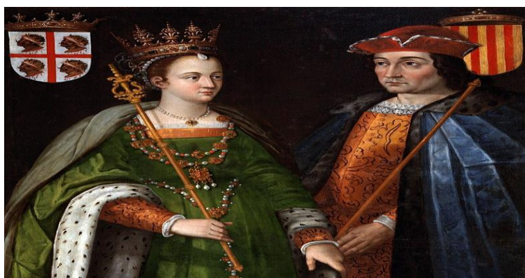
Ramón Berenguer IV de Catalunya, con Petronila, hija de Ramiro II de Aragón

Cataluña se configura como núcleo poblacional con cierta entidad, entre la presión carolingia por el norte y la musulmana por el sur, esos últimos que fueron expulsados por los francos que crearon diversos condados que se convirtieron, con el tiempo, en un dominio independiente y se confederaron con la Corona de Aragón. Ramón Berenguer IV de Catalunya, con Petronila, hija de Ramiro II de Aragón.