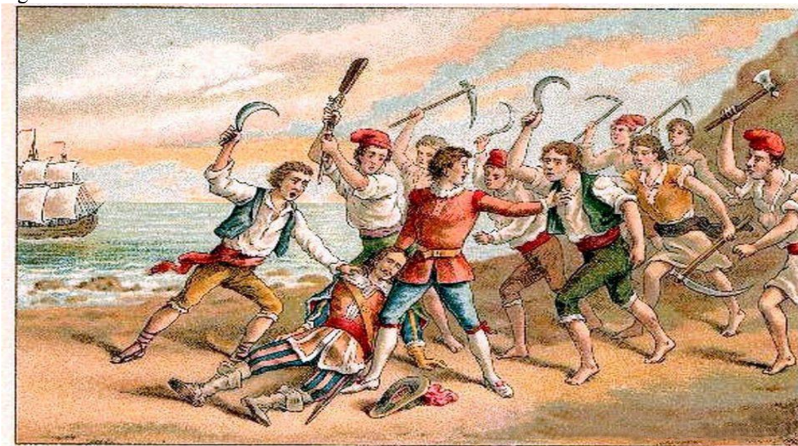
Guerra de los Segadores

Todos estos factores, fueron las causas inmediatas de la revuelta campesina en la cual empezó el levantamiento que marcó el inicio de la sublevación de Cataluña o guerra de segadores 1640-1652, que duró 12 años y de la cual proviene el himno catalán "los segadores".