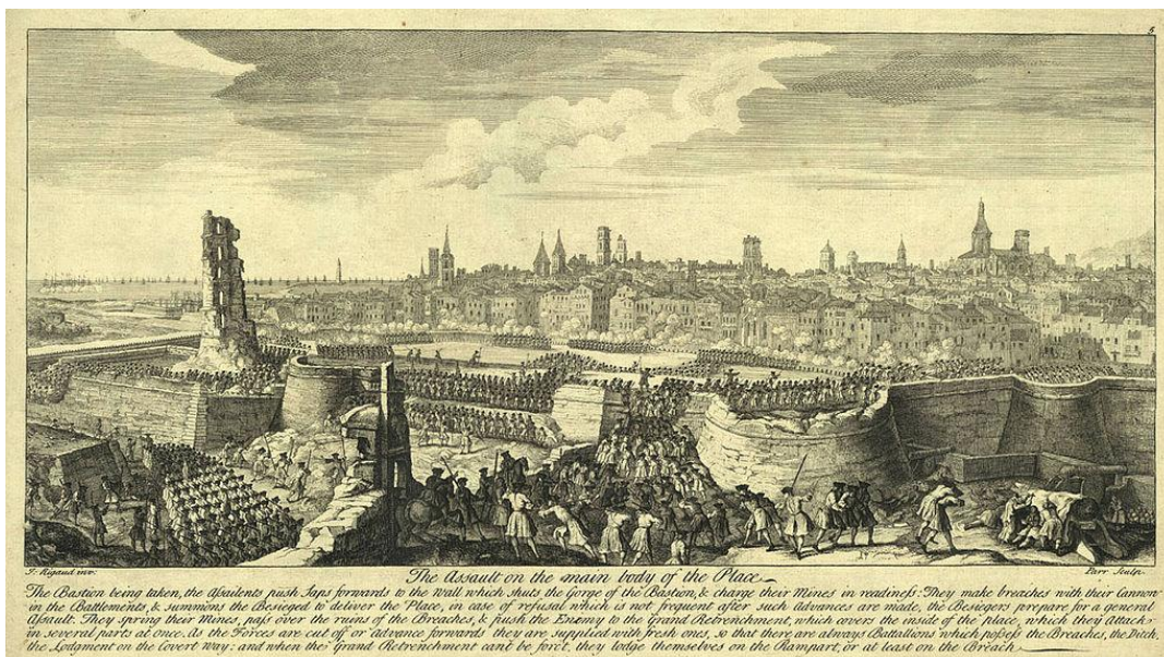
Asalto final de las tropas borbónicas sobre Barcelona el 11 de septiembre de 1714 23

1714. fecha que los catalanes nunca han olvidado. Pierre Vilar. Una nación forjada por la Historia, p n o 9.