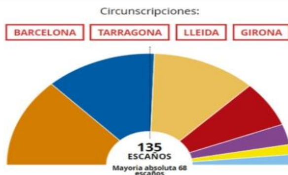
Gráfico n°1 : Resultados de las elecciones del 21 de diciembre de 2017