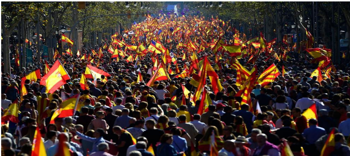
Miles de manifestantes desembarcan en Barcelona para defender la unidad de España:29/10/2017 49