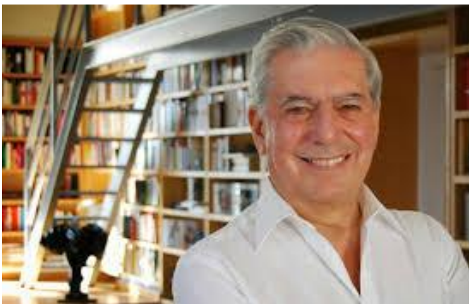
El autor Mario Vargas Llosa