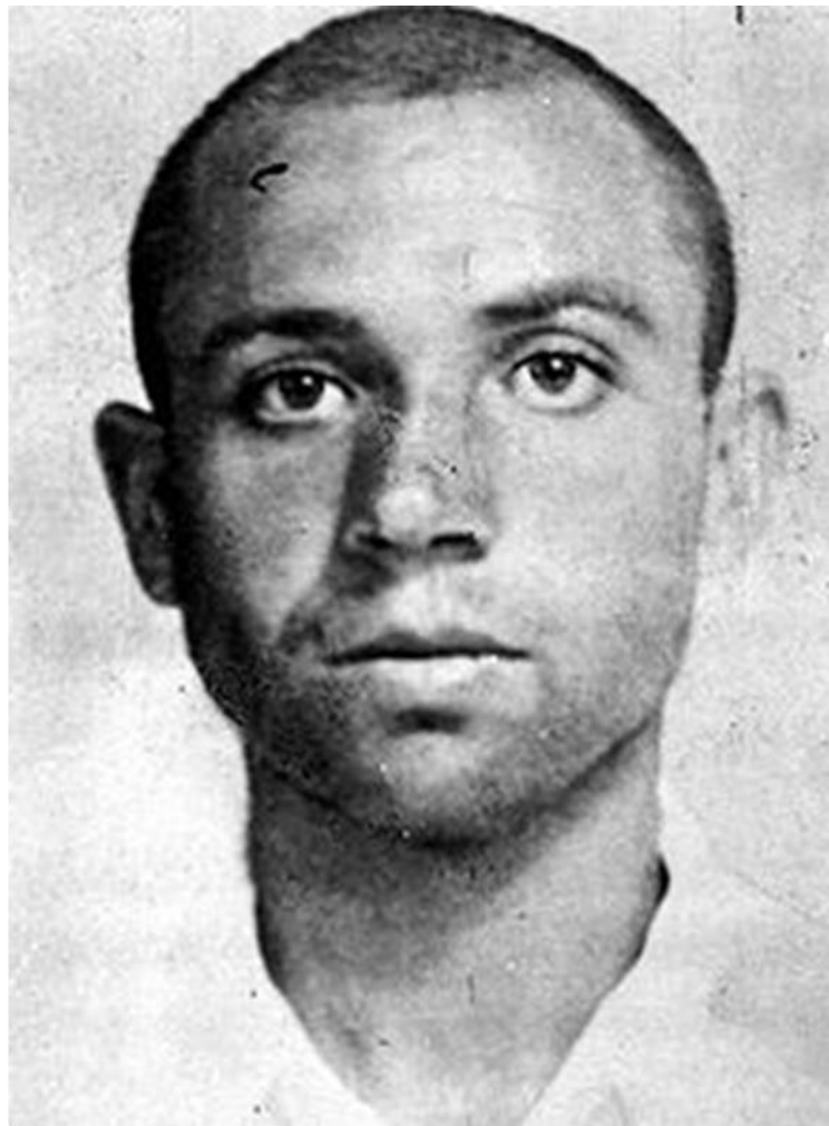
Miguel Hernández (1910-1942)